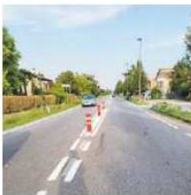
Interventi in via Cavin di Sala

Tutto ciò fa parte di un pacchetto di interventi, concordati con il Comune, che la Città metropolitana sta realizzando nelle strade provinciali di