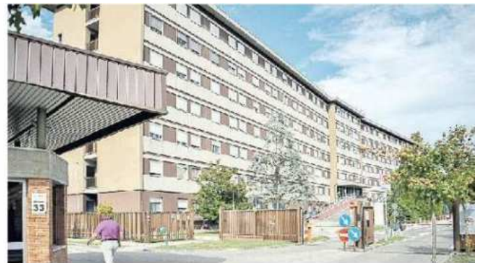
DOLO Un'immagine dell'ospedale