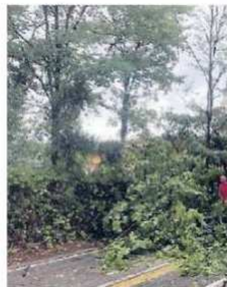
MIRANO Danni del maltempo